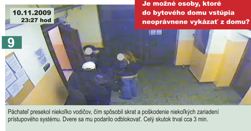
9 Páchateľ presekol niekoľko vodičov, čím spôsobil skrat a poškodenie niekoľkých zariadení prístupového systému. Dvere sa mu podarilo odblokovať. Celý skutok trval cca 3 min.

Ako môže obyvateľ či oprávnená osoba postupovať v prípadoch neoprávnených vstupov?