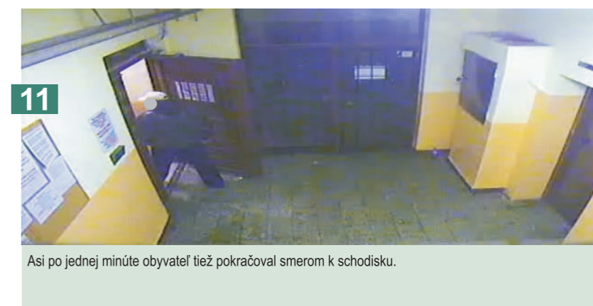
11 Asi po jednej minúte obyvateľ tiež pokračoval smerom k schodisku.