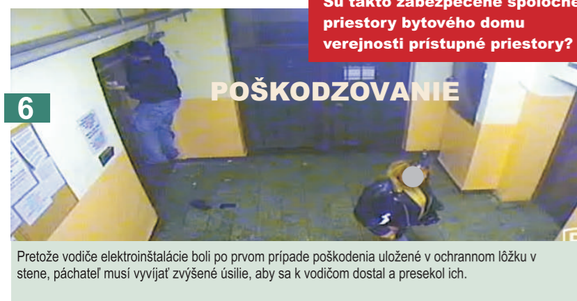
6 Pretože vodiče elektroinštalácie boli po prvom prípade poškodenia uložené v ochrannom lôžku v stene, páchateľ musí vyvíjať zvýšené úsilie, aby sa k vodičom dostal a presekol ich.

Aký je postih pre osoby, ktoré sa prizerajú poškodzovaniu majetku?