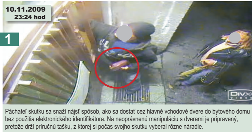
1 Páchateľ skutku sa snaží nájsť spôsob, ako sa dostať cez hlavné vchodové dvere do bytového domu bez použitia elektronického identifikátora. Na neoprávnenú manipuláciu s dverami je pripravený, pretože drží príručnú tašku, z ktorej si počas svojho skutku vyberal rôzne náradie.

V tomto prípade bola spôsobená škoda vo výške 132 EUR, ktorá zahŕňala výmenu elektroniky operačnej jednotky, zálohového zdroja, nakoľko páchateľ spôsobil skrat v elektroinštalácii, čo poškodilo niektoré zariadenia prístupového systému. V tejto sume je zahrnutá aj oprava elektroinštalácie a oprava poškodenej steny.