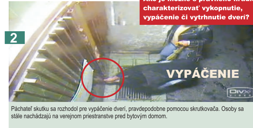
2 Páchateľ skutku sa rozhodol pre vypáčenie dverí, pravdepodobne pomocou skrutkovača. Osoby sa stále nachádzajú na verejnom priestranstve pred bytovým domom.

Ako je možné s právneho hľadiska charakterizovať vykopnutie, vypáčenie či vytrhnutie dverí?