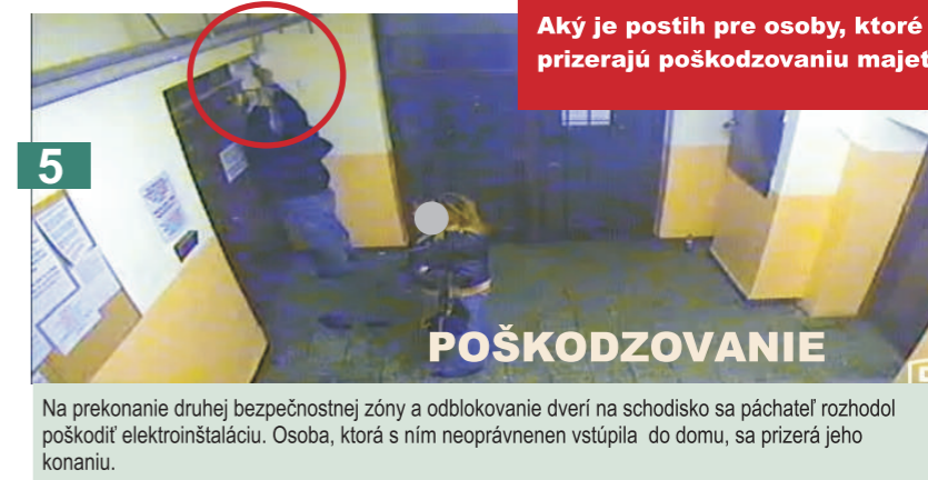
5 Na prekonanie druhej bezpečnostnej zóny a odblokovanie dverí na schodisko sa páchateľ rozhodol poškodiť elektroinštaláciu. Osoba, ktorá s ním neoprávnenne vstúpila do domu, sa prizerala jeho konaniu.

Aký postih hrozí osobe vstupujúcej do bytového domu neoprávnenne?