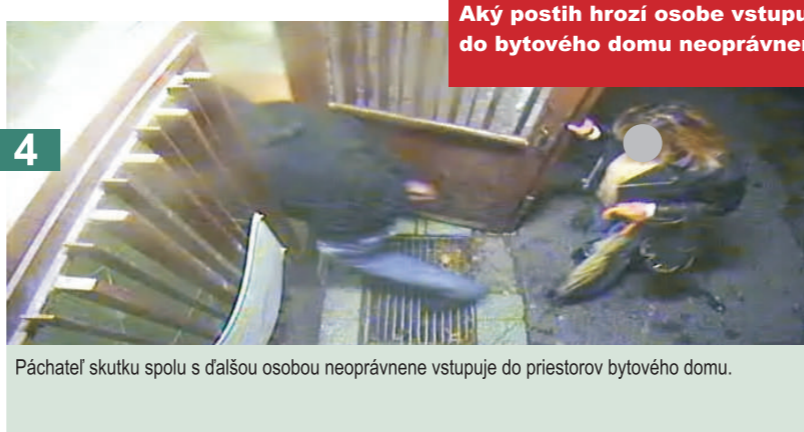
4 Páchateľ skutku spolu s ďalšou osobou neoprávnenne vstupuje do priestorov bytového domu.

Aké právomoci má polícia, pokiaľ je svedkom alebo je privolaná k takémuto prípadu?