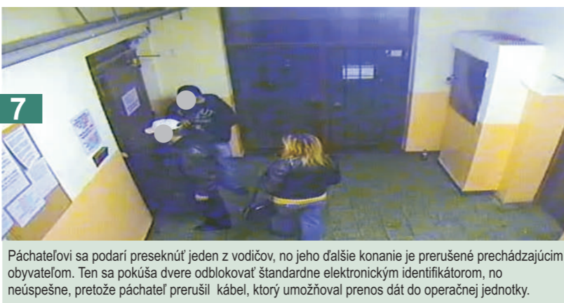
7 Páchateľovi sa podarí preseknúť jeden z vodičov, no jeho ďalšie konanie je prerušené prechádzajúcim obyvateľom. Ten sa pokúša dvere odblokovať štandardne elektronickým identifikátorom, no neúspešne, pretože páchateľ prerušil kábel, ktorý umožňoval prenos dát do operačnej jednotky.

Sú takto zabezpečené spoločné priestory bytového domu verejnosti prístupné priestory?