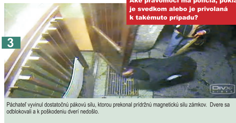
3 Páchateľ vyvinul dostatočnú pákovú silu, ktorou prekonal prídržnú magnetickú silu zámkov. Dvere sa odblokovali a k poškodeniu dverí nedošlo.

Ako je možné s právneho hľadiska charakterizovať vykopnutie, vypáčenie či vytrhnutie dverí?