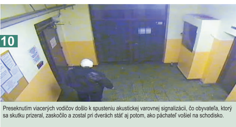
10 Preseknutím viacerých vodičov došlo k spusteniu akustickej varovnej signalizácie, čo obyvateľa, ktorý sa skutku prizeral, zaskočilo a zostal pri dverách stáť aj potom, ako páchateľ vošiel na schodisko.

Je možné osoby, ktoré do bytového domu vstúpia neoprávnenne vykázat' z domu?